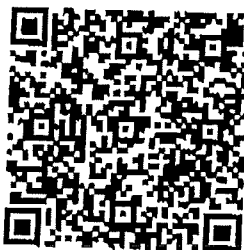
ดาวน์โหลด มาตรฐานขั้นตอนการปฏิบัติ (SOP)